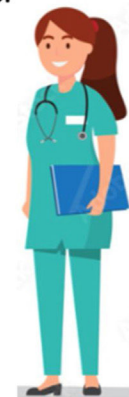
Figura 3 Profesionales que intervienen en la transferencia de pacientes entre quirófano y UCIP. Adaptado de Lane-Fall et al. Figuras «diseñadas por macrovector/Freepik».